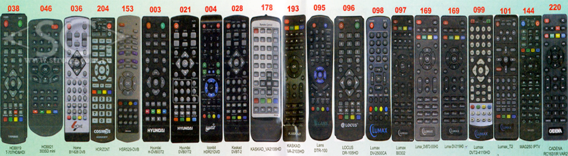
038 HO8819 T-707HD&HD 046 HO8821 3035D mini 036 Home BY-628 DVB 204 HOKZONT 153 HSR529-DVB 003 Hyundai H-DVB003T2 021 Hyundai DV801T2 004 Isonbit HDR21DVD 028 Kaskad DVB-T 178 KASKAD_VA2109HD 193 KASKAD VA-2103HD 095 Lans DTR-100 096 LOCUS DR-105HD 098 Lumax DV-2500CA 097 Lumax B0302 169 Lumax_DVB2-655HD 169 Lumax DV2-119HD 099 Lumax DV2-4110HD 101 Lumax_T2 144 MAG250 IPTV 220 CADENA RC1631R VAR2